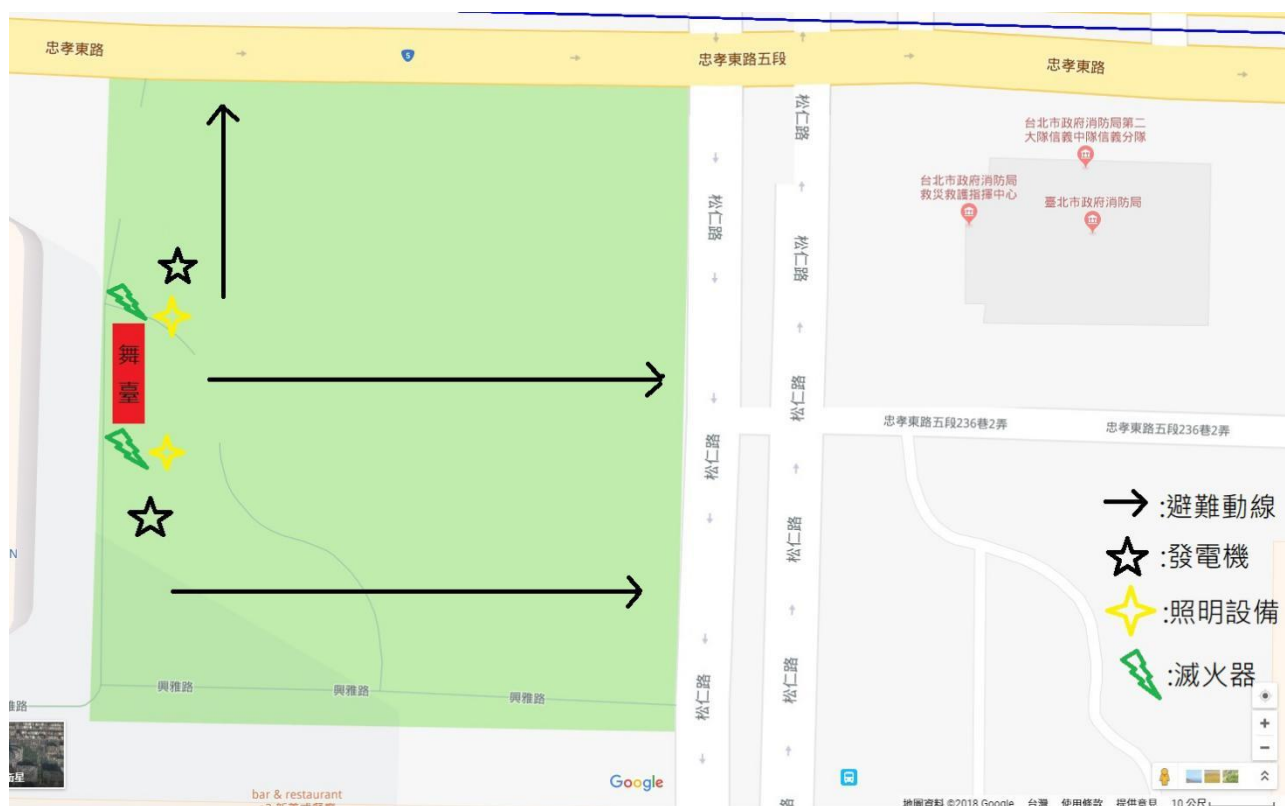
附件 2: 避難逃生路線圖(下方為範例圖)