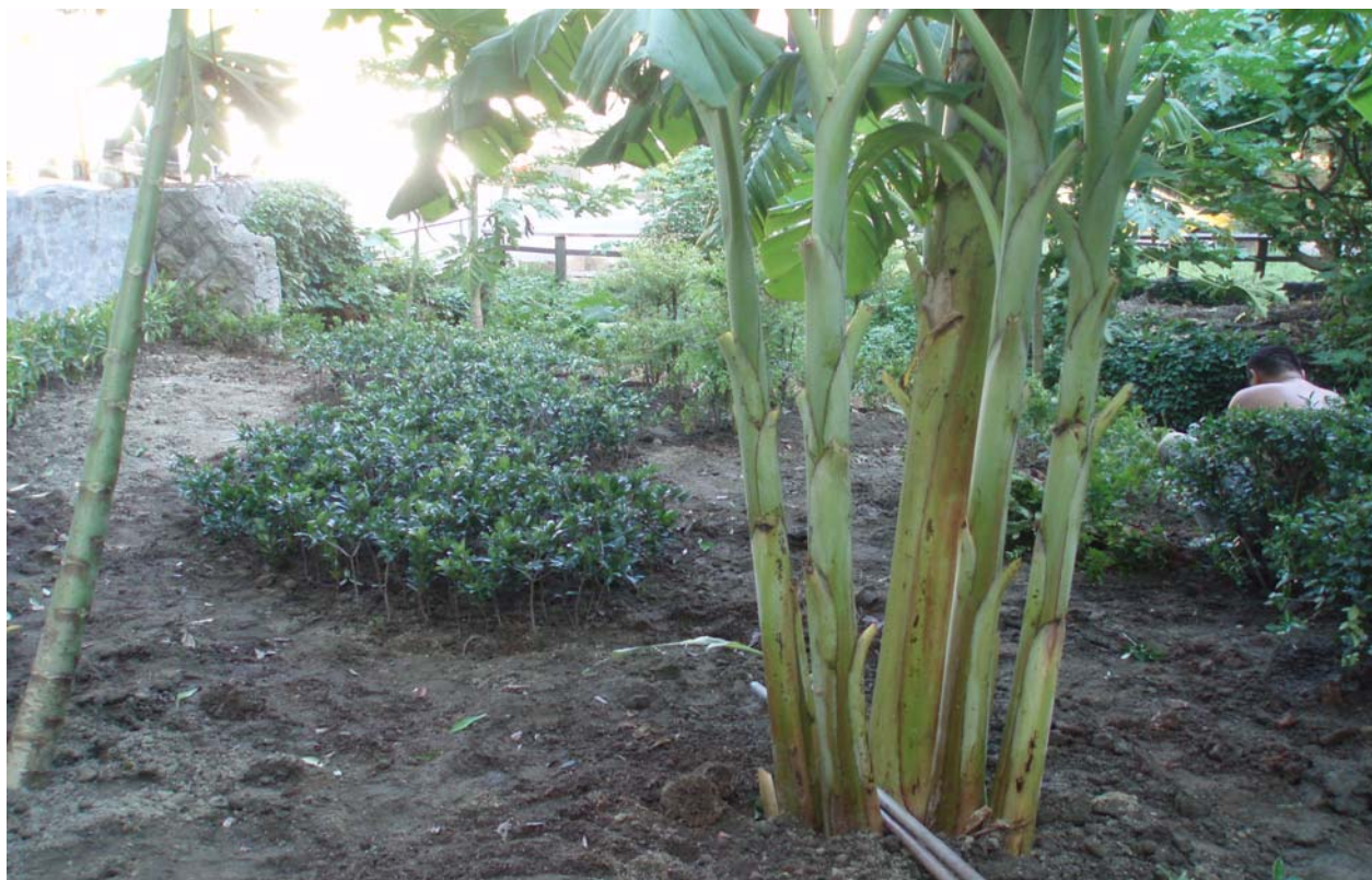
照片 9 公園內綠化植栽作業中