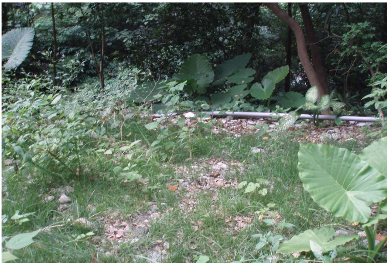
照片 3 公園內綠化植栽前景觀