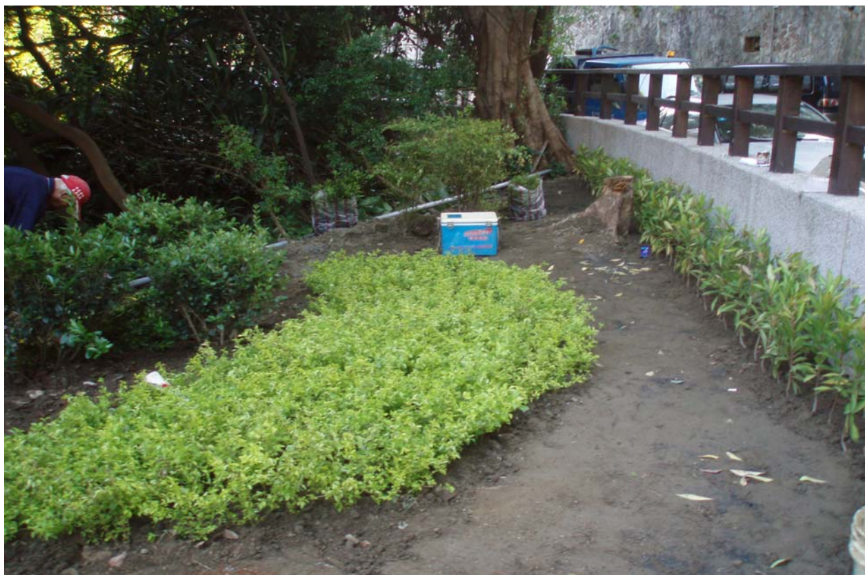
照片 8 公園內綠化植栽作業中