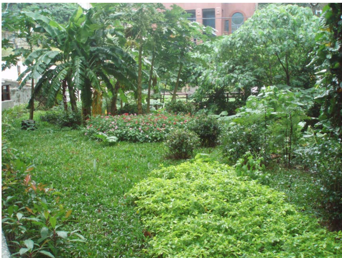
照片 4 公園內綠化植栽後續觀察生長情形

本次園區施作綠美化植栽作業前，已先詢問專家相關意見及建議選擇適合北投地區土壤、環境之植物。今（102）年 9 月栽種後，後續觀察植物之生長情形良好（如後附照片 4），本處亦會持續辦理維護園區植物生長及綠美化工作。