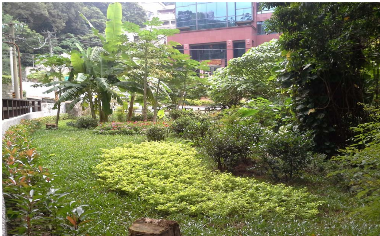
照片 13 公園內綠化植栽作業後