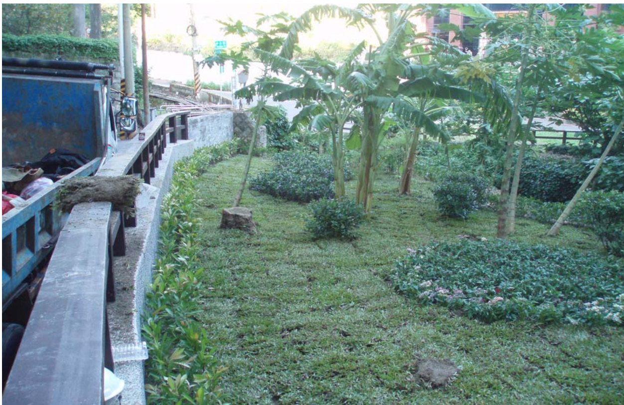
照片 11 公園內綠化植栽作業中