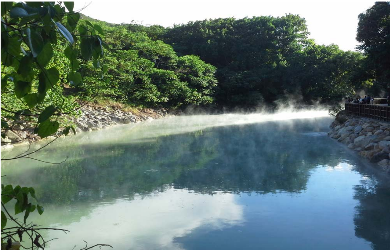
照片 1 地熱谷公園青磺溫泉露頭，湖光藍天美景

園區內設有「北投石復育區」、「青磺溫泉水堰」、「地熱谷小舖」等多項設施供民眾參觀。惟青磺溫泉之 pH 值介於 1~2 間，溫泉水中硫酸根與氯離子含量極高，使得園區內及週遭設施極易遭腐蝕損壞，亟需維護整修，俾能提供整體園區遊客安全及美好景觀。