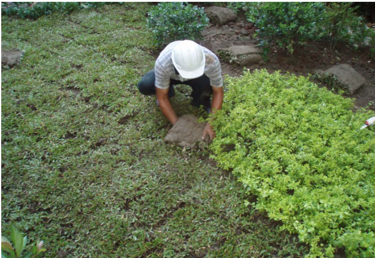
照片 10 公園內綠化植栽作業中