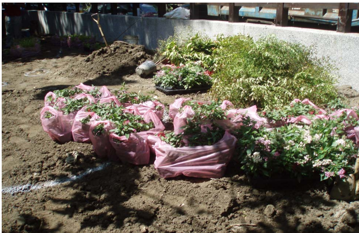
照片 7 公園內綠化植栽作業中