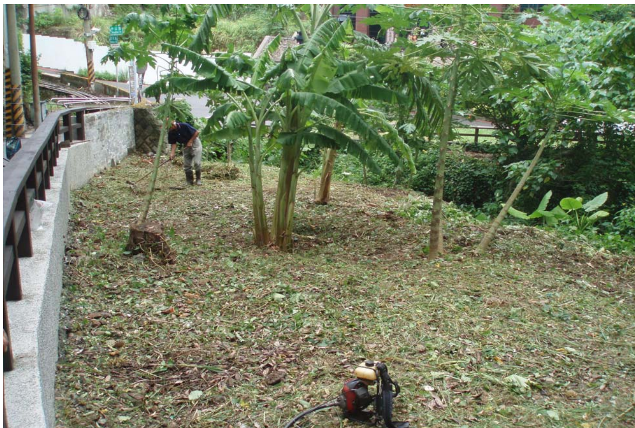
照片 5 公園內綠化植栽作業中