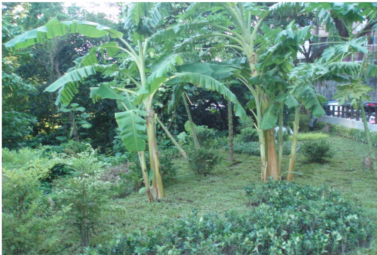
照片 12 公園內綠化植栽作業後