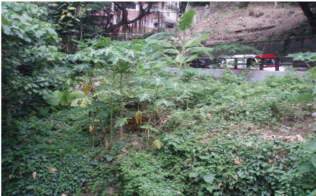
照片 2 公園內綠化植栽前景觀