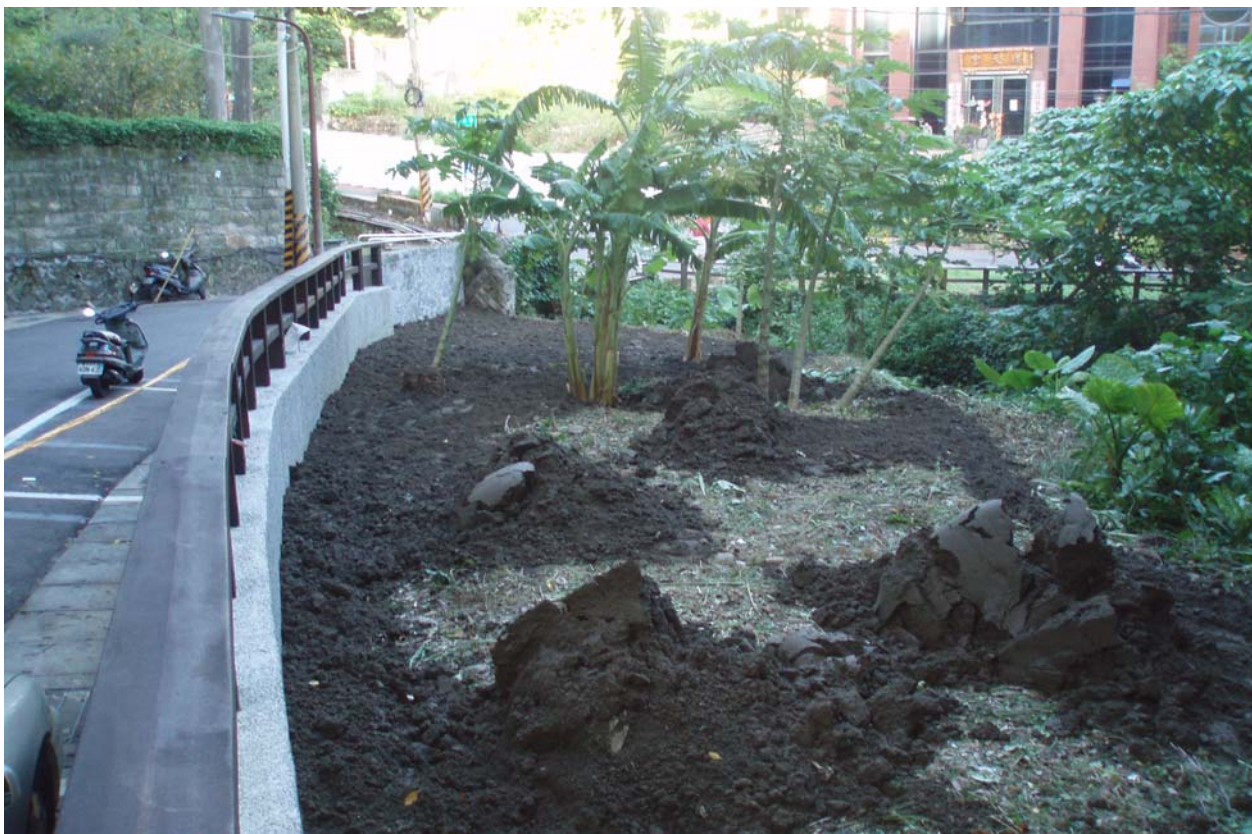
照片 6 公園內綠化植栽作業中