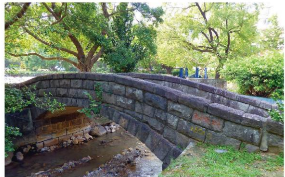
北投公園 Beitou Park 台北市溫泉發展協會