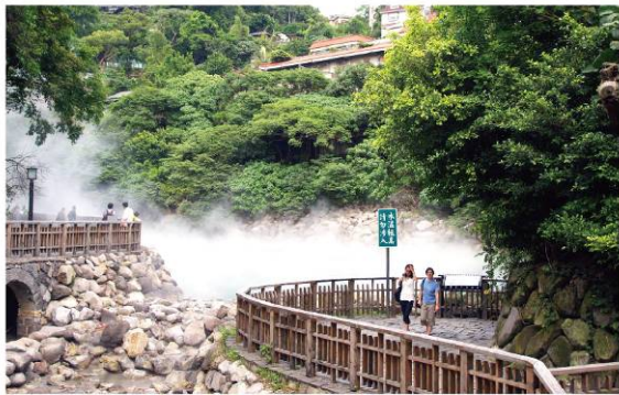
北投地熱谷景觀公園 Beitou Thermal Valley Scenery Park 台北市溫泉發展協會