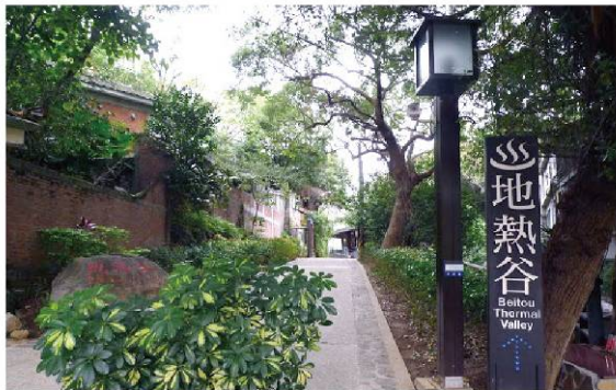
北投地熱谷景觀公園 Beitou Thermal Valley Scenery Park 台北市溫泉發展協會