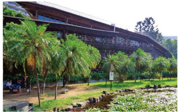
台北市立圖書館北投分館 Taipei Public Library Beitou Branch 台北市溫泉發展協會