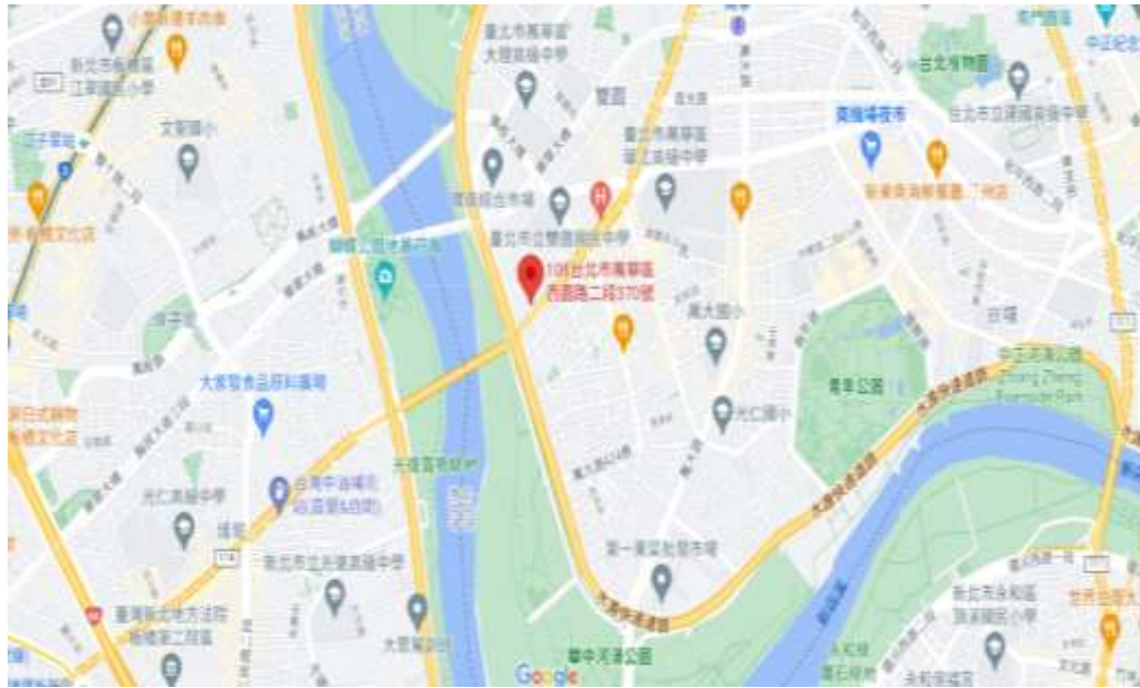
圖別:地籍地形圖套繪圖