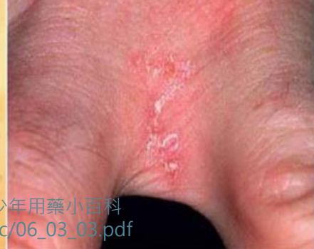
◎疥蟲於皮下寄生所挖掘的疥隧道