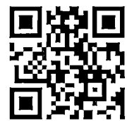
研討會報名 QR CODE

備註：一切遵照、配合政府新型冠狀病毒肺炎防疫規定，會議室內禁止飲食，請多多配合。另響應環保署規定，一律不提供紙杯，務請自備環保杯。