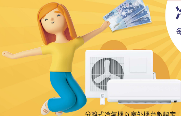
分離式冷氣機以室外機台數認定