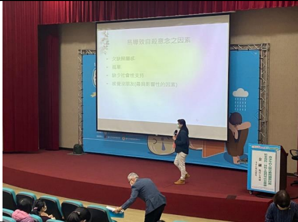
冬青心理治療所 金融臨床心理師