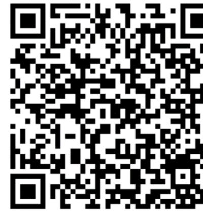
臺北市土地使用 分區查詢