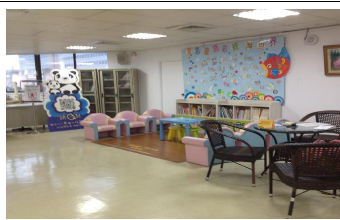
中正區公所友善育兒空間