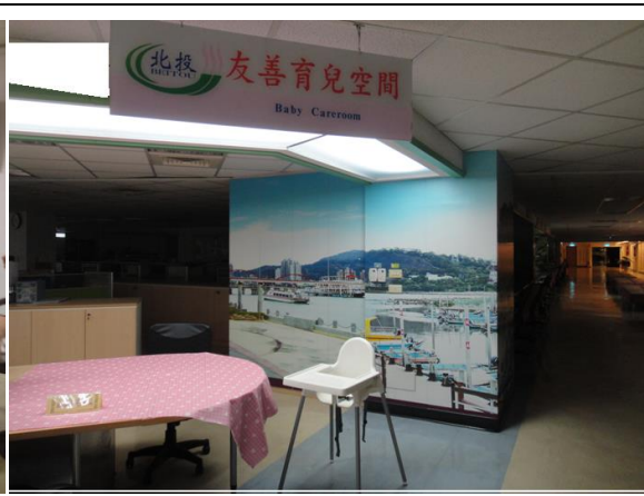
北投區公所友善育兒空間