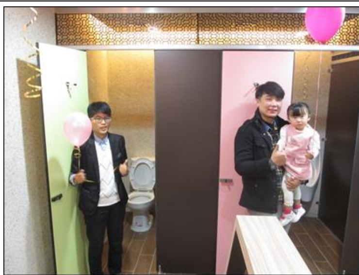
大安區公所性別友善廁所