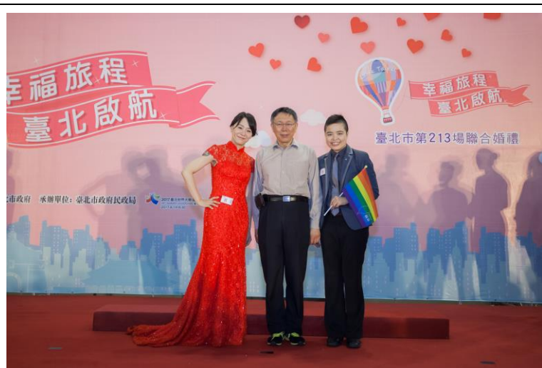
105 年第 2 場聯合婚禮