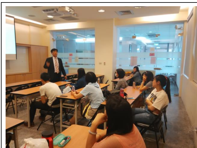
兩性相處藝術課程

為增進新移民在臺生活適應能力，協助其入境後能及早適應婚姻生活、認識本地文化背景，本局陸續開辦新移民生活成長營暨各類研習課程，並於課程中納入性別平等概念，例如：開辦兩性相處、家庭經營等課程。