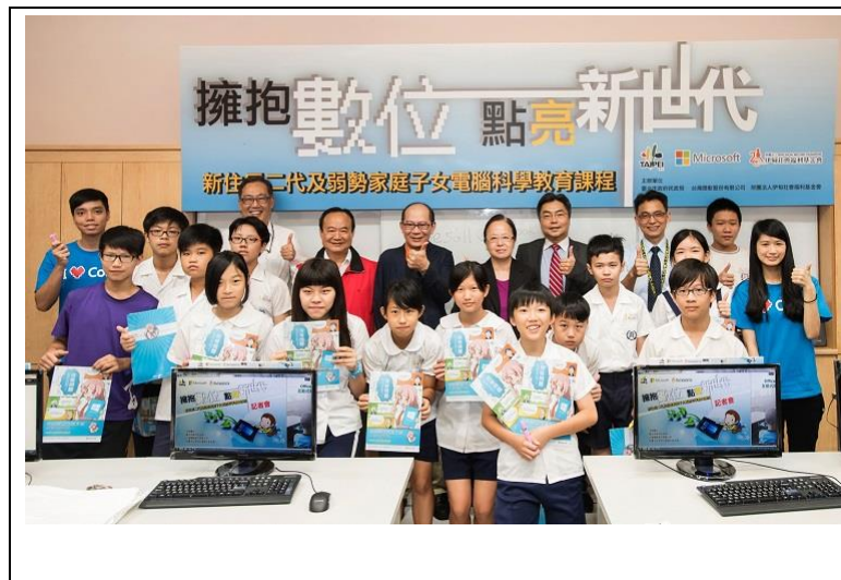
「擁抱數位 點亮新世代」新住民二代及弱勢家庭子女電腦科學教育課程記者會

微軟公司提供了 32 部全新的電腦、軟體與師資，由萬華新移民會館提供電腦教室，伊甸基金會開辦電腦課程及招生，優化本市新移民服務品質。