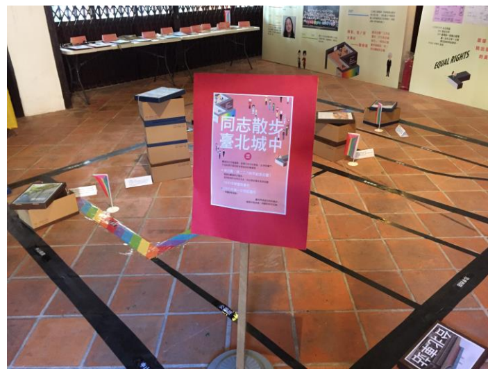
105 年同志公民活動-「LGBT 多元性別展」