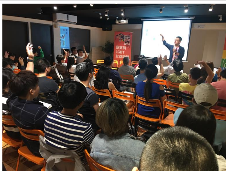
105 年同志公民活動-「LGBT 友善職場論壇」