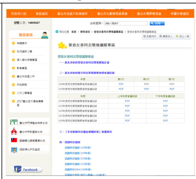
民政局官網>營造友善同志環境議題專區