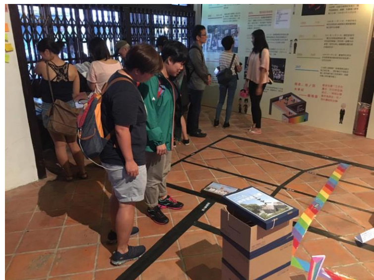
105 年同志公民活動-LGBT 多元性別展