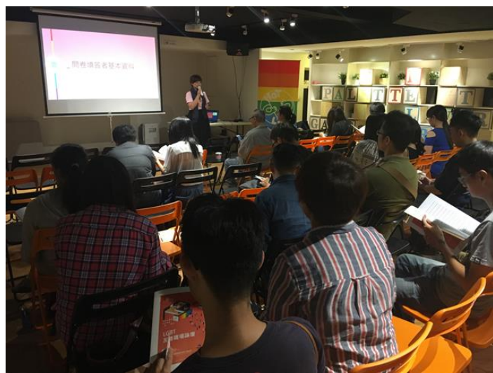
105 年同志公民活動-「LGBT 友善職場論壇」