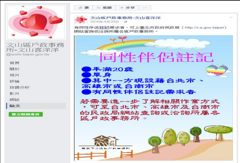
文山區戶政事務所臉書 https://www.facebook.com/pg/wshr.taipei.gov.tw/posts/?ref=page_internal