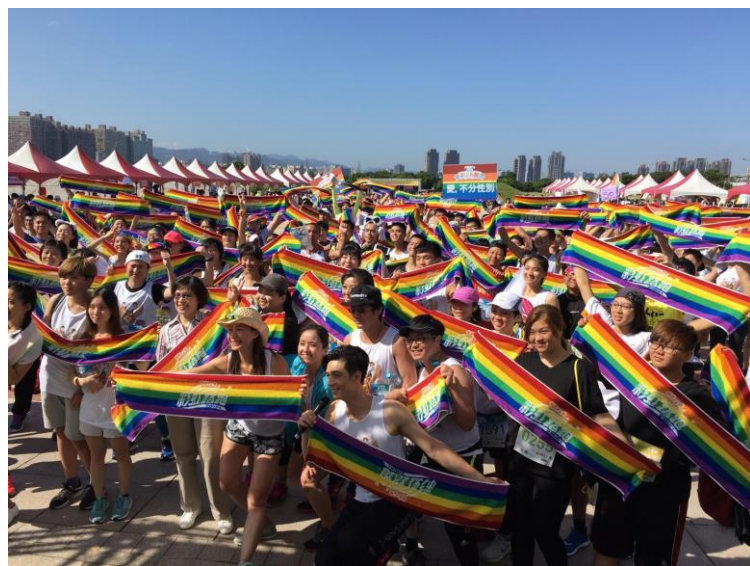
105 年同志公民活動-「彩虹早餐趣」市集園遊會暨第三屆彩虹路跑活動