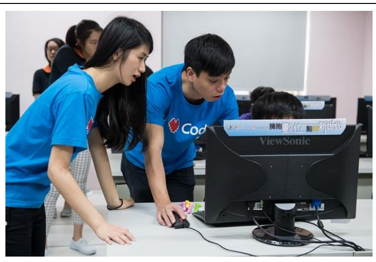
台灣微軟教學人員教學生操作 SWAY 軟體