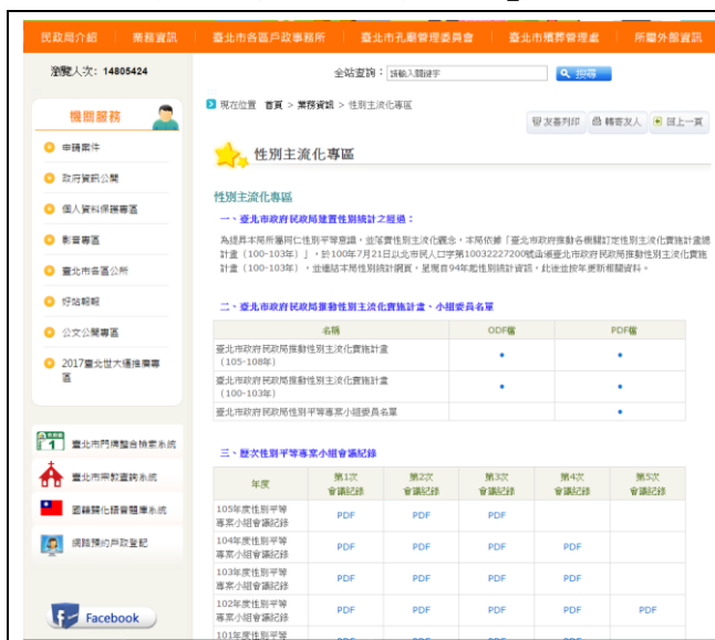
民政局官網>性別主流化專區