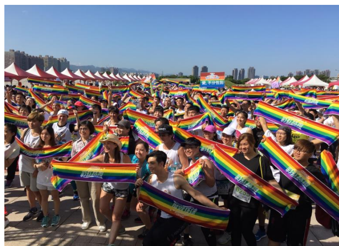
105 年同志公民活動-「彩虹早餐趣」市集園遊會暨第三屆彩虹路跑活動