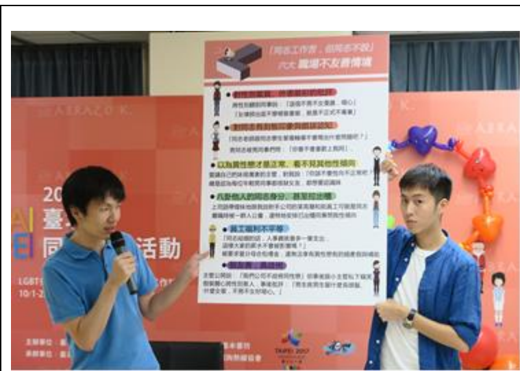
105 年同志公民活動記者會-公布六大職場不友善情境

以「工作在臺北—行行同志做自己」為主題，分別辦理「彩虹早餐趣」市集園遊會、「LGBT 多元性別展」及「LGBT 友善職場論壇」等系列活動。其中「同志工作苦，但同志不說」—公布六大職場不友善情境與 OS 投稿活動，藉由調查並公布同志朋友們在職場上所遭遇到真實狀況及內心想法，希望提升市民大眾的性別敏感度，建立友善多元性別的職場環境；「LGBT 友善職場論壇」則邀請各工作領域的同志員工現身分享自身工作經驗，並由公、私部門代表分享如何營造友善職場。