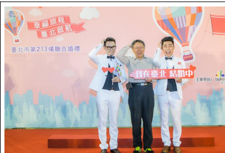
105 年第 2 場聯合婚禮

自 104 年 10 月 24 日(104 年第 2 場聯合婚禮)，首度開放同志伴侶報名參加，以尊重包容、自由平等原則辦聯合婚禮，卸除傳統婚姻性別框架。105 年共 2 對同性伴侶參加。