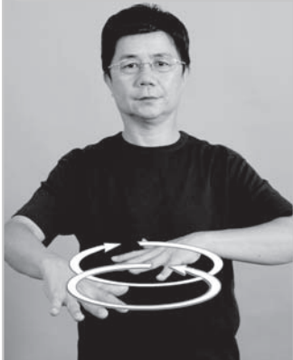
12-004 打麻將A Playing Mahjong

動作： 左右【手】掌心朝下，交替繞圈作打麻將洗牌狀 詞源： 比擬打麻將洗牌的動作