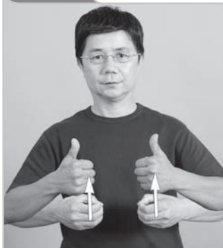
12-001 談妥 (談定) Reach A Agreement

動作： 左右【零】掌心相對，在胸前重複打開後上拉成【男】 詞源： 源自“談” + “敲定”的複合詞