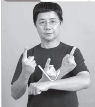
12-006 差一個 (剩一個) One Less (One Left)

動作： 右【一】拳底由上而下碰左【手】手背後彈起 用法： 依實際數量，調整數字適用