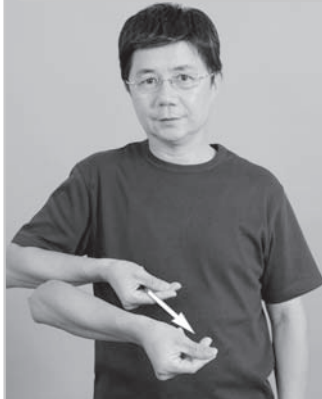
12-004 打麻將B Playing Mahjong

動作： 右【鴨】掌心朝上指尖朝前，中指食指縮起作打麻將摸牌狀 詞源： 比擬打麻將摸牌的動作