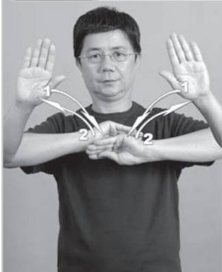
12-005 熬夜 (通宵、一整晚) Stay Up

動作： 左右【手】掌心向外由兩旁做弧形移向眼前交叉收成【萬】再反向打開成【手】 詞源： 源自「從天黑到天亮」