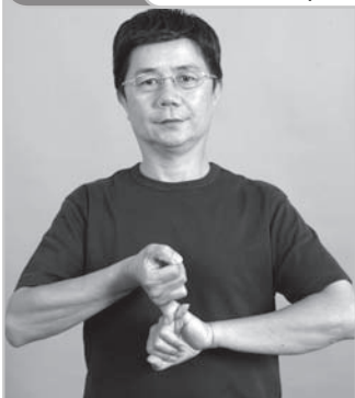
12-002 訂 (訂定、約、上海) Promise (Subscribe, Shanghai)