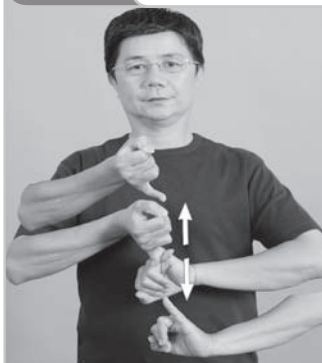
12-003 失約 (爽約、黃牛) Break Promise (Cop Out)

動作： 左右【零】掌心相對，在胸前重複打開後上拉成【男】 詞源： 源自“談” + “敲定”的複合詞