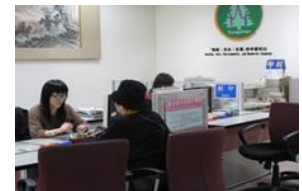
◆台北卡-敬老/愛心乘車證櫃檯

考量蒞所申請及展延敬老、愛心悠遊卡之民眾不乏行動不便或年長者，我們研擬客製化貼心服務，特將悠遊卡櫃檯延伸至本行政中心 1 樓，提供申辦人隨到即辦的快速、便捷服務，省去等候電梯、取號等待時間。