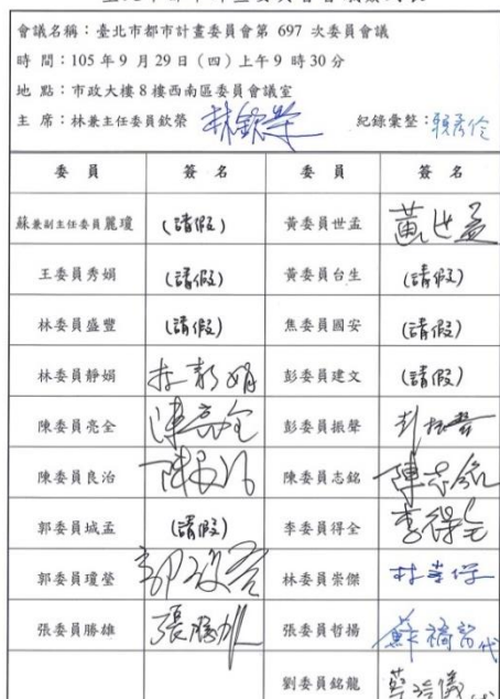
臺北市都市計畫委員會會議簽到表