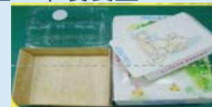
6. 塑膠餐盒、紙餐盒、竹製餐盒、木製餐盒