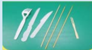
8. 塑膠刀、塑膠叉、竹叉